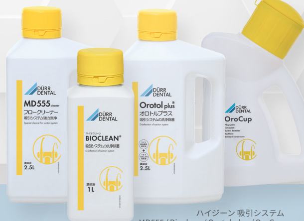
ハイジーン 吸引システム MD555 / Bioclean / Orotol plus / OroCup

近年では洗口液やパウダークリーニングの導入が増加したことで、流れるものも多様化してきました。この機に適切なお手入れ方法を知ってみませんか？